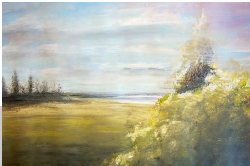
Dieses Bild entstand in unserem Kreativatelier.